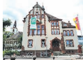
Altes Rathaus Denzlingen

Ab 8. Juli wird vor dem Denzlinger Rathaus wieder die Flagge des weltweiten Bündnisses der Mayors for Peace wehen. Mehr als 500 Kommunen in Deutschland zeigen mit der Aktion in diesem Jahr ihre Solidarität mit der Ukraine und setzen sich für eine friedliche Welt ohne Atomwaffen ein.