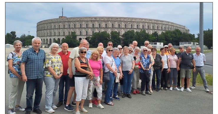
Die Denzlinger VdK-Reisegruppe beim Besuch in Nürnberg.