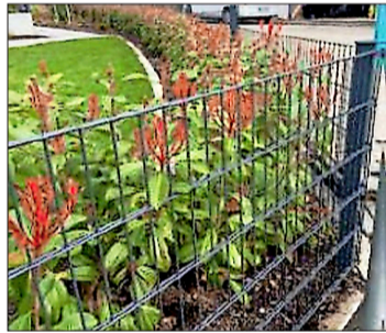
Beispiel für eine „kombinierte“ Einfriedung.