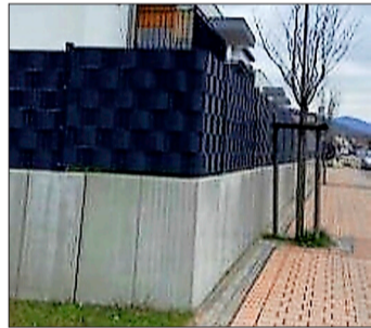
Beispiel für eine „tote“ Einfriedung