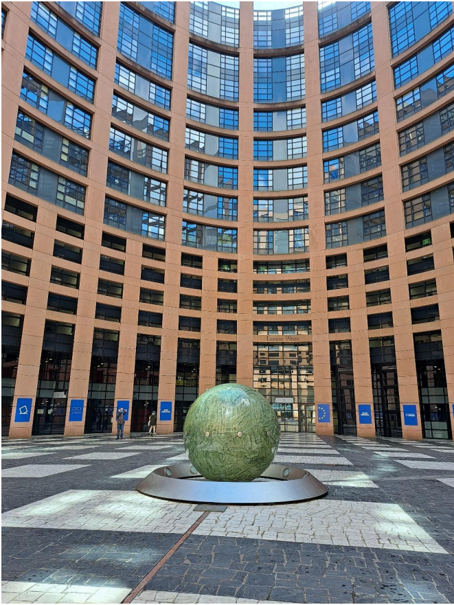
Foto im Innenhof des Europäischen Parlaments