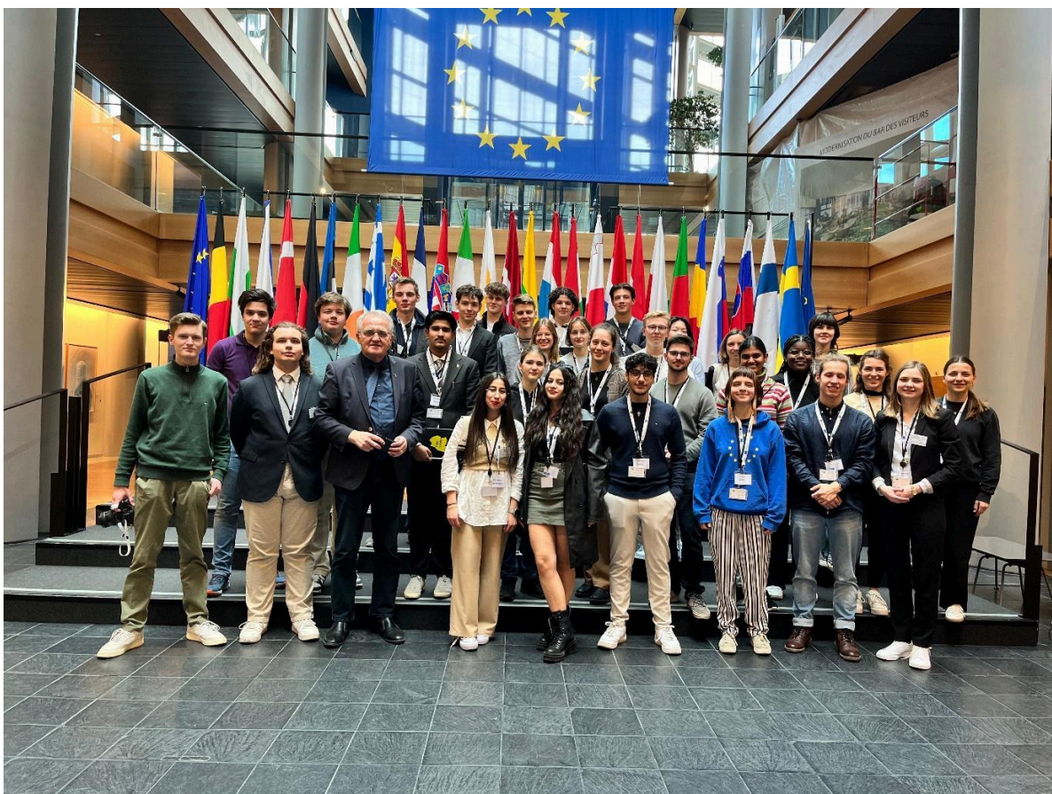
Gruppenfoto mit Rainer Wieland, Abgeordneter der EVP Fraktion des Europäischen Parlaments

Insgesamt waren es zwei spannende und ereignisreiche Tage an denen wir viel gelernt haben.