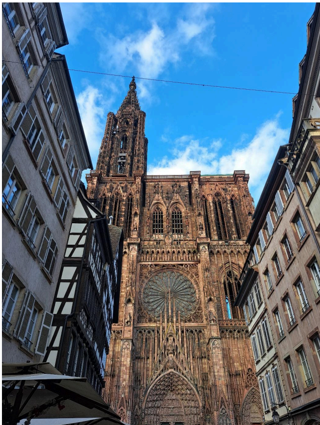
Foto vom Straßburger Münster