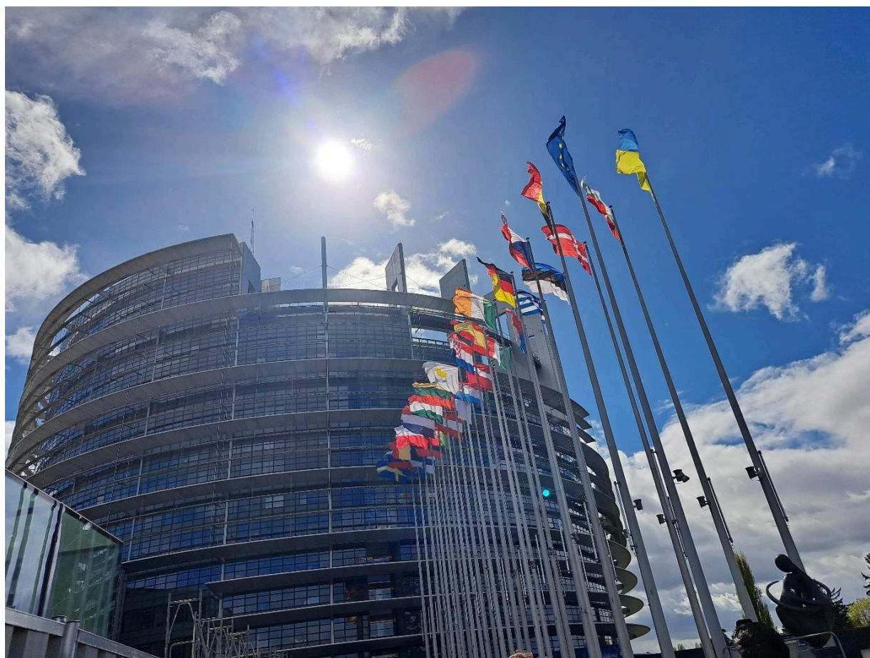
Foto vom Parlament von außen