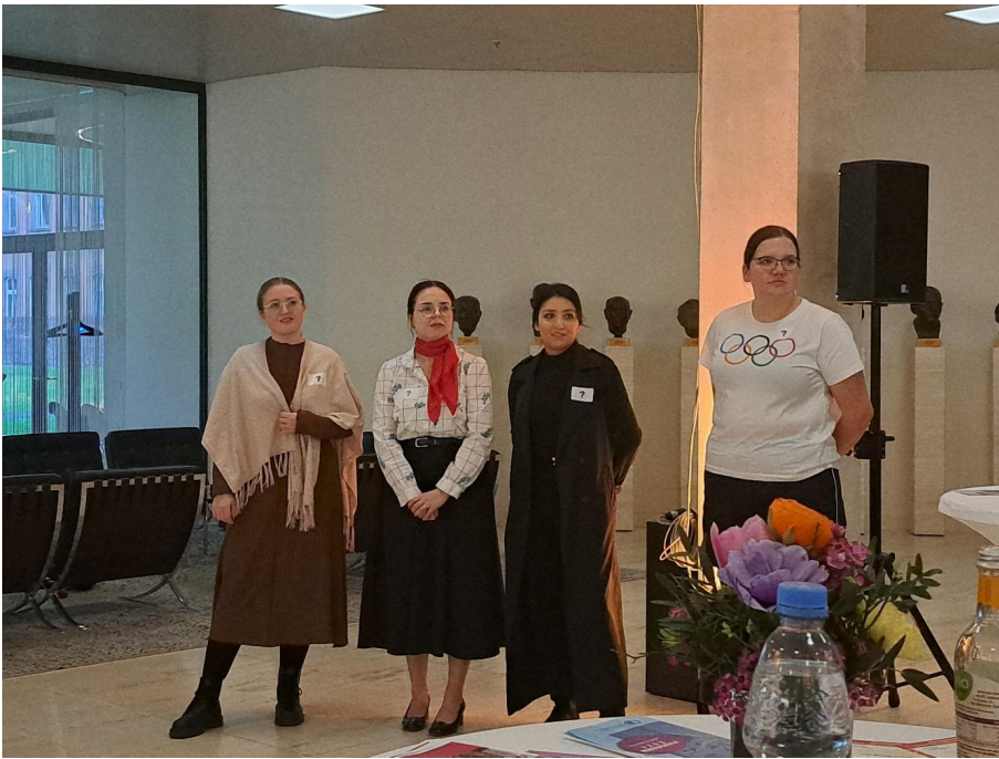
Foto von den vier Schauspielerinnen, die die historischen Frauenfiguren dargestellt haben