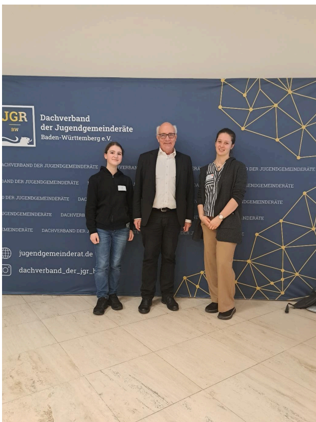
Foto mit dem Landtagsabgeordneten Alexander Schoch von den Bündnis 90 die Grünen