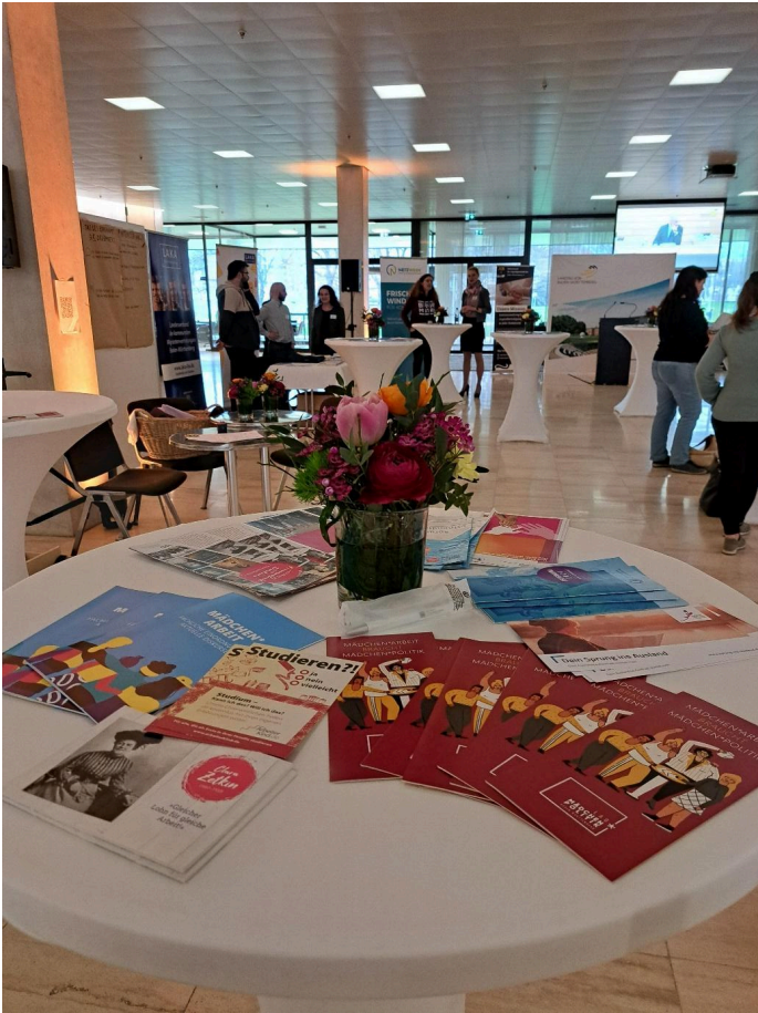
Foto vom Marktplatz