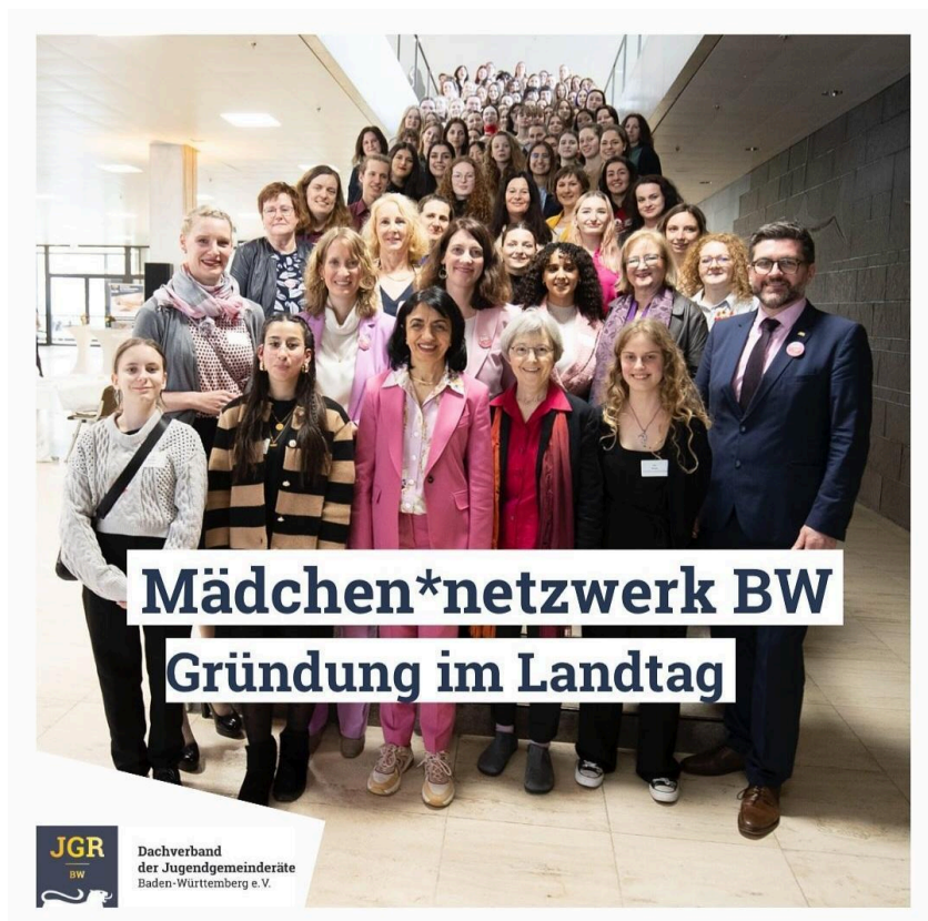
Gruppenfoto von der Gründung des Mädchen*netzwerk BW im Landtag

Der Dachverband der Jugendgemeinderäte hatte außerdem 4 historische Frauenpersonen aus der Geschichte ausgewählt, die wir und die anderen Teilnehmerinnen mit Hilfe eines Quiz identifizieren sollten. Dies war unser Highlight des Abends, da die Schauspielerinnen auf unsere Fragen nur mit Ja und Nein antworten durften. Am Ende konnten wir tatsächlich nur zwei von vier richtig erraten.