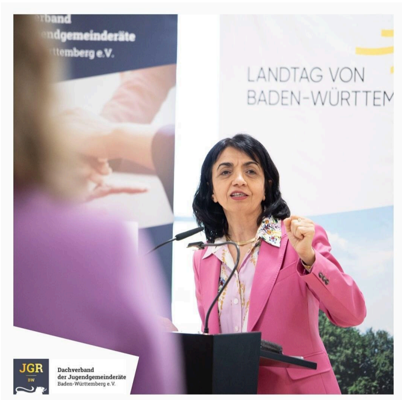
Foto von der Landtagspräsidentin Muhterem Aras