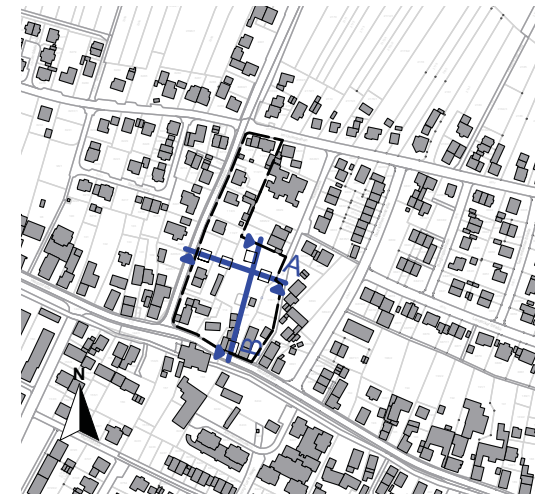
Übersichtsplan M 1 : 5000